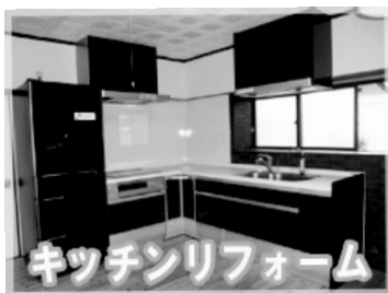
キッチンリフォーム