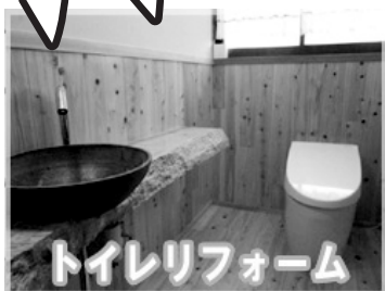
トイレリフォーム